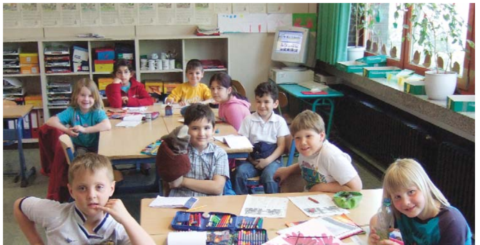
Gemeinsam lernen: Die Duisburger Schüler stammen aus rund 25 Nationen und von drei Kontinenten.

EU-Projekt mit Schulen aus Polen, Ungarn, Tschechien und Lettland. Nachmittags können die Regenbogen-Kinder ihre Muttersprache lernen: Kroatisch, serbokroatisch, bosnisch, kurdisch und italienisch wird angeboten, z.T. in Kooperation mit Schulen der Nachbarschaft.