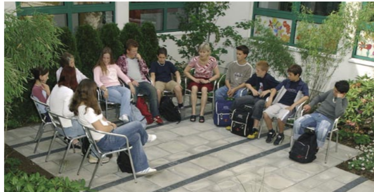
Peter-Ustinov-Gesamtschule, Monheim: Neugestalteter Atrium-Innenhof, Landschaftsarchitekt: Dirk Scheunpflug