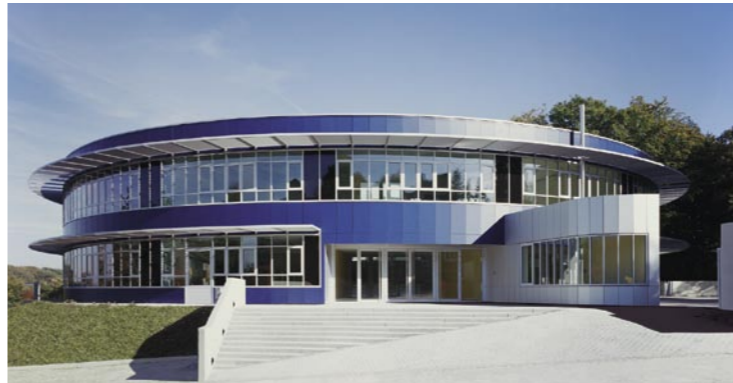
Schule für Erziehungshilfe, Velbert Architekt: Roland Dorn, Köln/Paderborn