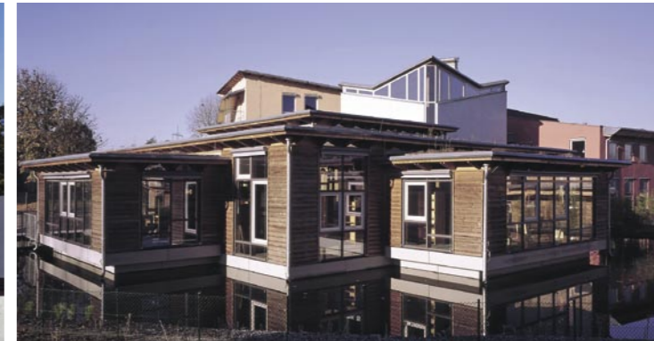
Evangelische Gesamtschule in Gelsenkirchen-Bismarck Architekten: Plus + bauplanung GmbH, Hübner Forster Egler, Neckarenzlingen