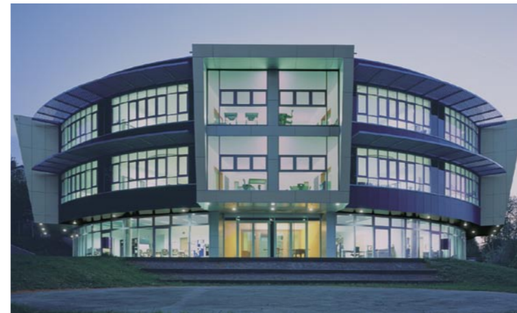
Schule für Erziehungshilfe, Velbert Architekt: Roland Dorn, Köln/Paderborn